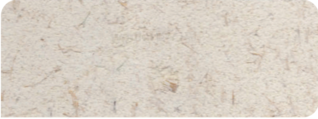
ZDC 基料+面 : X - 110