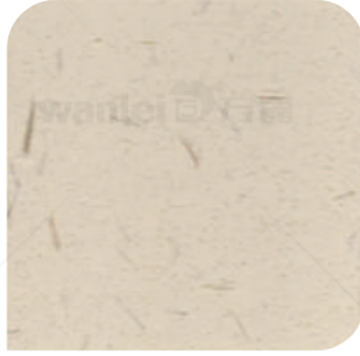
XDC - 0102