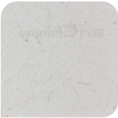
XDC - 1362