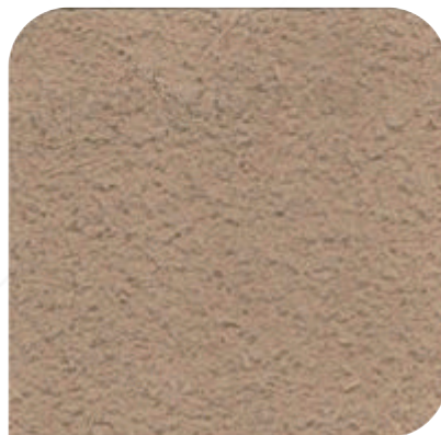
ZDC - 3C16