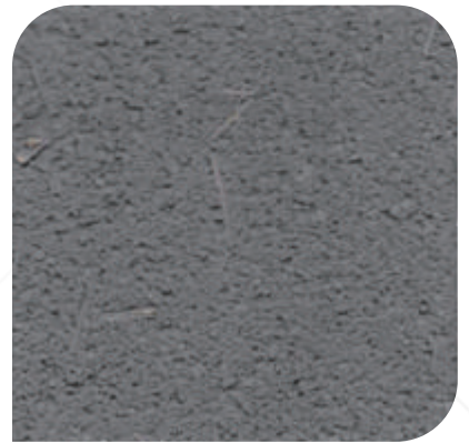
ZDC - M57