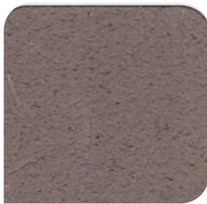
ZDC - 3023