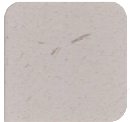
XDC - 0902