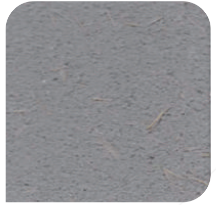
ZDC - M41