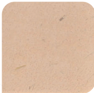
XDC - 0142