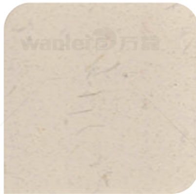
XDC - 0122