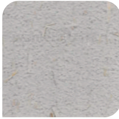
ZDC - 1362