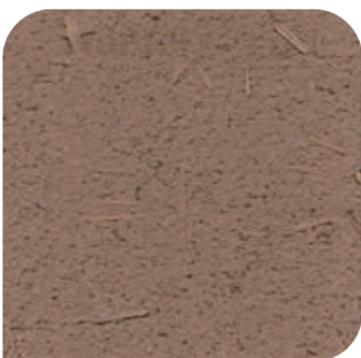
ZDC - 3C17