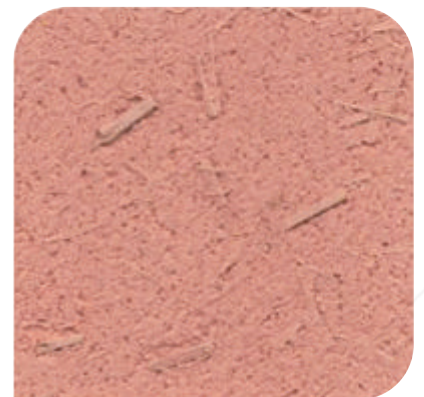
ZDC - 3013