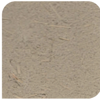
ZDC - 3C14