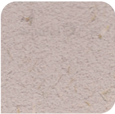
ZDC - 0901