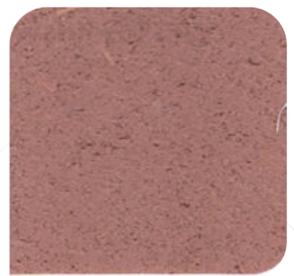
ZDC - M87