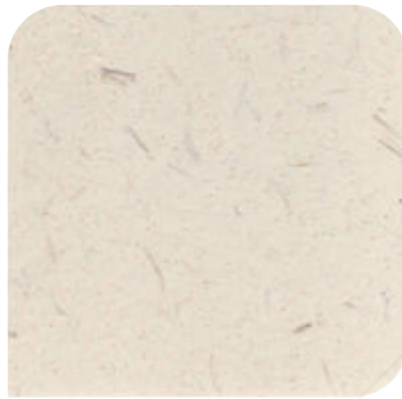
XDC - 0101