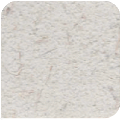
ZDC - 基料