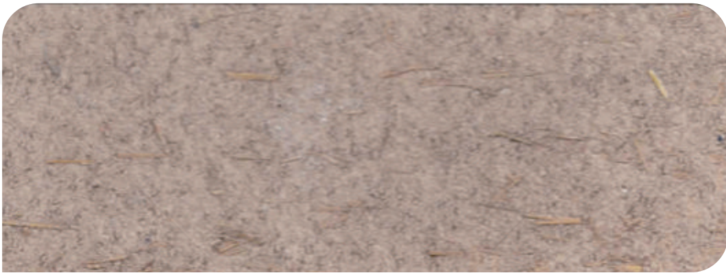
ZDC 基料+面 : X - 102