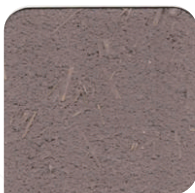
ZDC - 0906