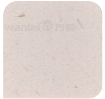
XDC - 0901