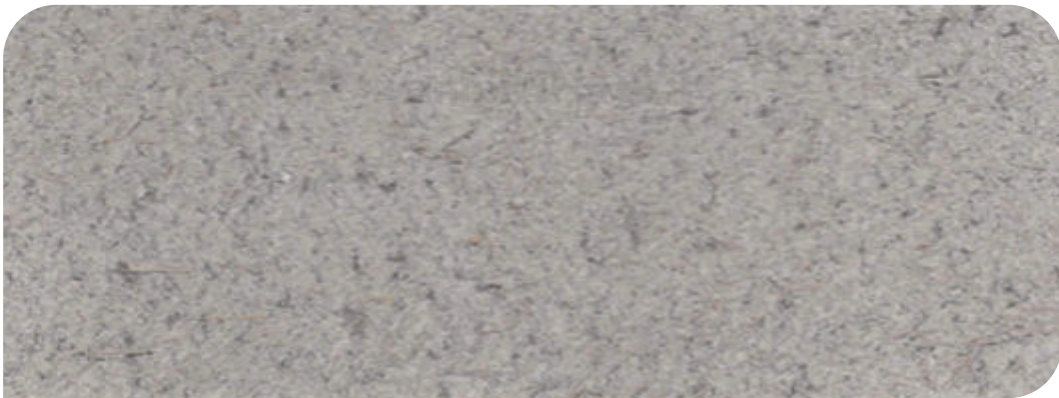
ZDC 基料+面 : X - 105