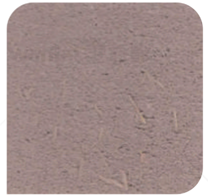
ZDC - M50