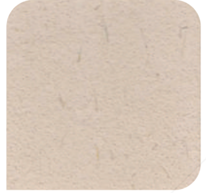
XDC - 0141