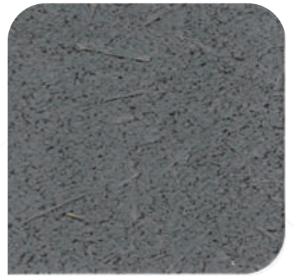
ZDC - M86