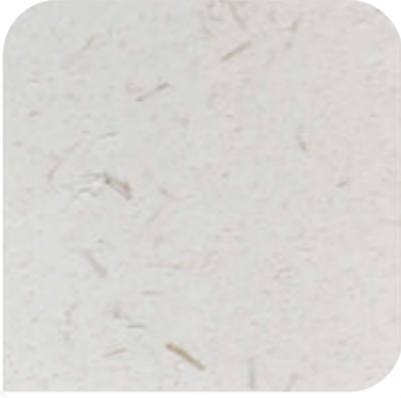
XDC - 基料