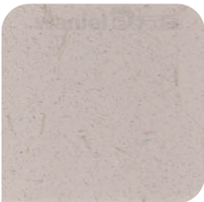
XDC - M18