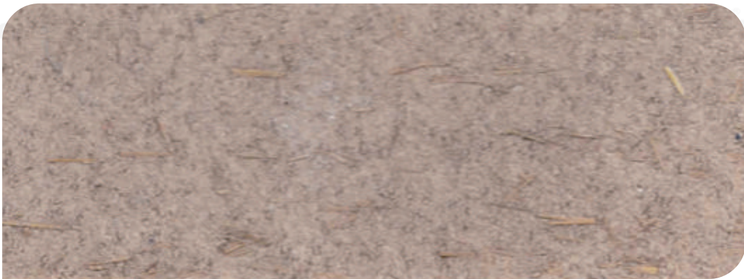
ZDC 基料+面 : X - 114

说明: 本页为擦色系列产品, 基底材料全部采用中稻草ZDC作为基料, 擦色产品施工顺序: 底漆 - 主材 - 保护膜 - 擦色。