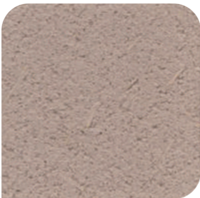
ZDC - 1396