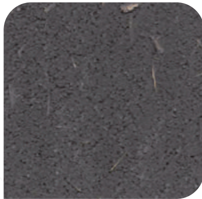
ZDC - M56