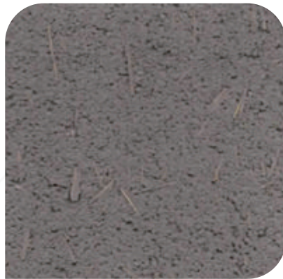
ZDC - M82