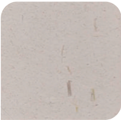
XDC - M31