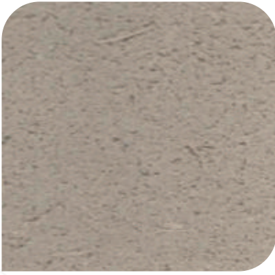
ZDC - M25