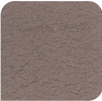
ZDC - M38