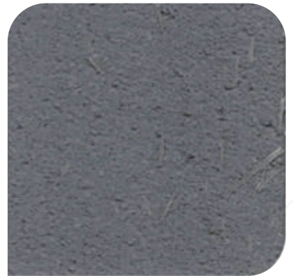
ZDC - 3024