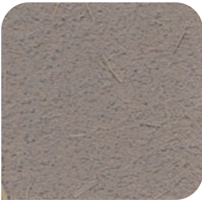
ZDC - M37