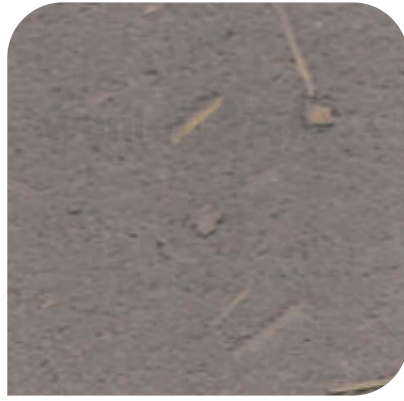
ZDC - M79