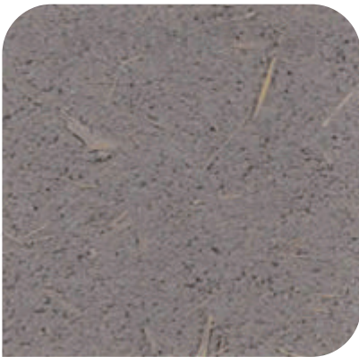
ZDC - M40